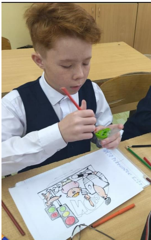
Рисование на тематику ПДД